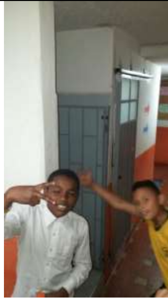
ENTRADA A BAÑOS