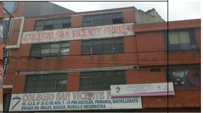
VENTANAS SEGUNDO Y TERCER NIVEL