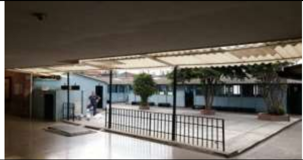
AREA DE PATIO INTERNO