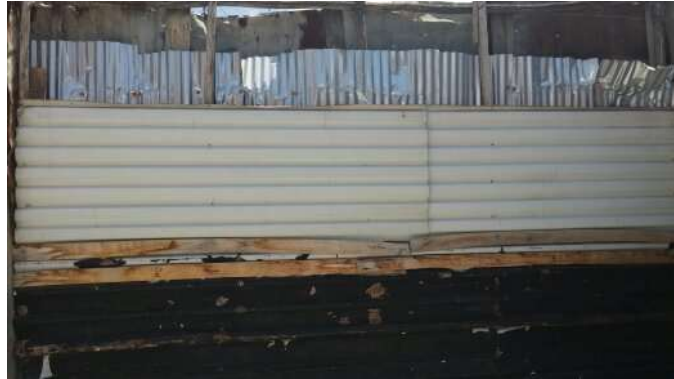
CERRAMIENTO A LOTE PERIMETRAL