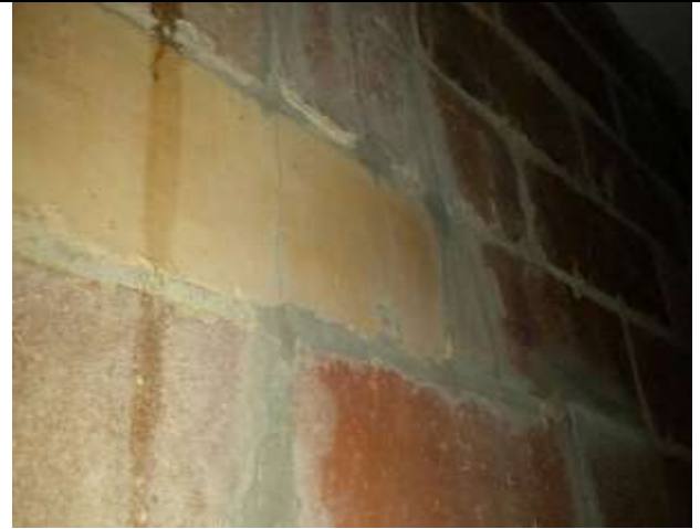
FISURA EN MURO