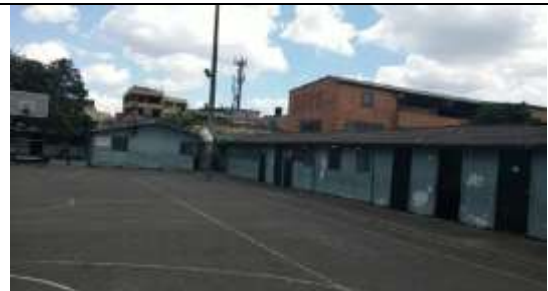
BLOQUES PATIO EXTERIOR