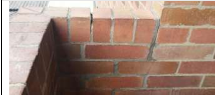
DILATACION EN BALCON