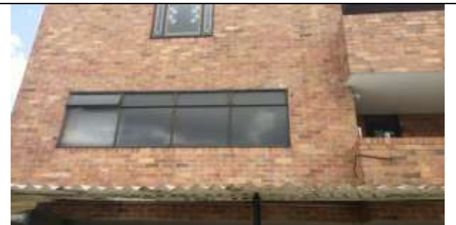
MURO CON FALLA Y GRIETAS