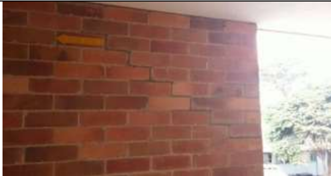
FISURAS EN MUROS