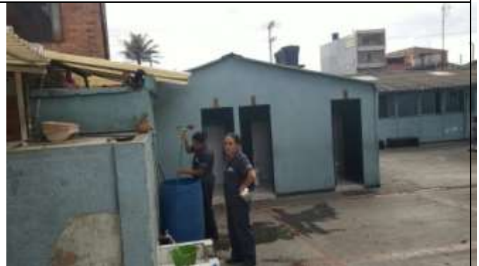
AREA DE ASEO Y BAÑOS