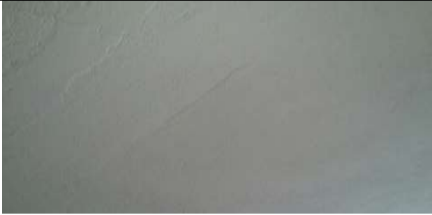
FISURA EN PLACA