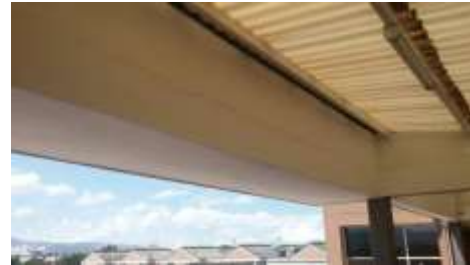
FISURA VIGA CANAL