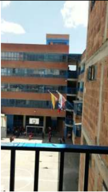
ADOSADO D ELAS DOS EDIFICACIONES