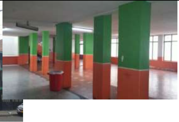
SALON INTERNO DE LAS AULAS