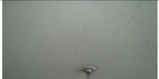
FISURA EN PLACA