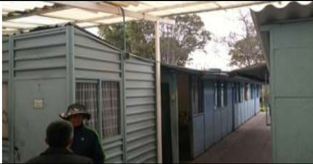
ZONAS DE AULAS SIN CUBIERTA