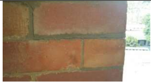
MUROS FISURADOS SIN TRAVA