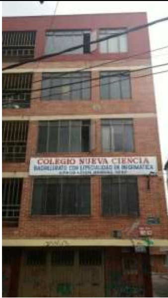
FRENTE DEL INMUEBLE