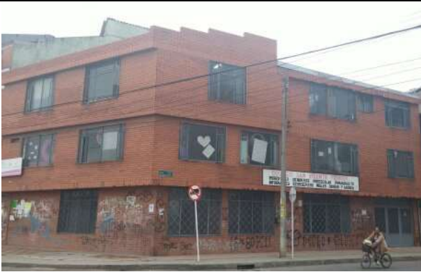
EDIFICIO PLANTEL EDUCATIVO