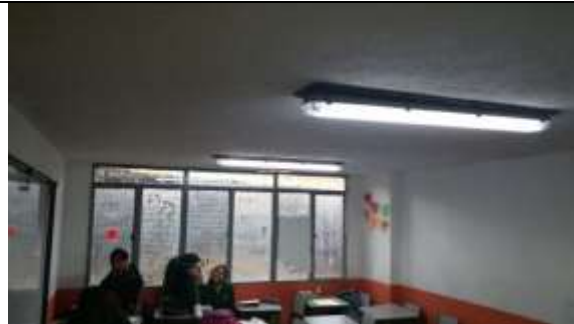
SALON DE CLASE