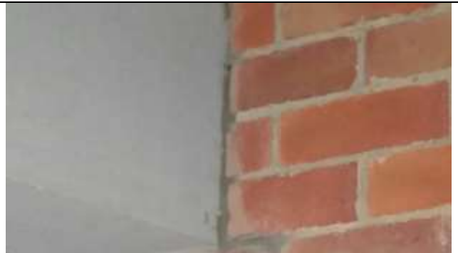
DILATACION EN MUROS FISURADOS