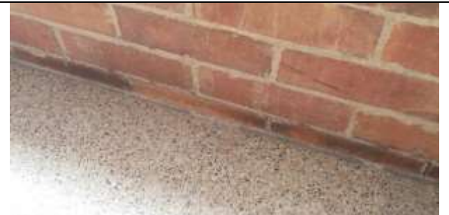
FISURA EN MUROS Y PISOSO DEL BALCON