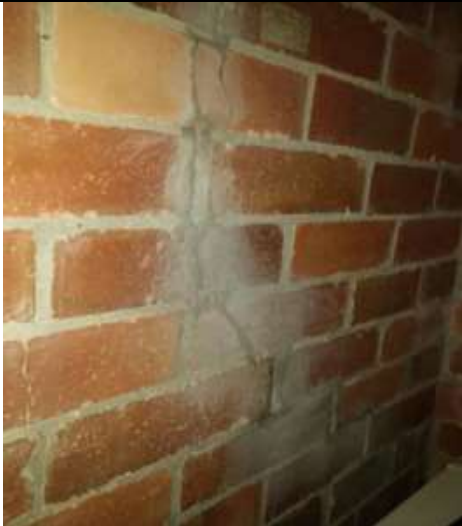
FISURA CON RESANA EN MURO INTERNO Y EXTERNO