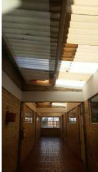
CUBIERTA DE SALONES