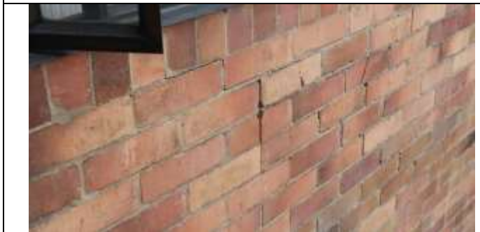
MUROS EXTERIORES CON GRITAS