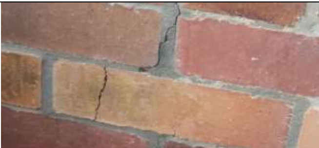
MURO CON FISURAS