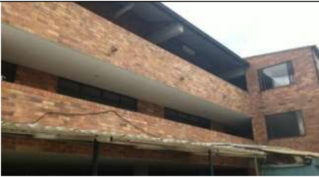
BOLOQUE DE TEATRO Y AULAS TRES NIVELES