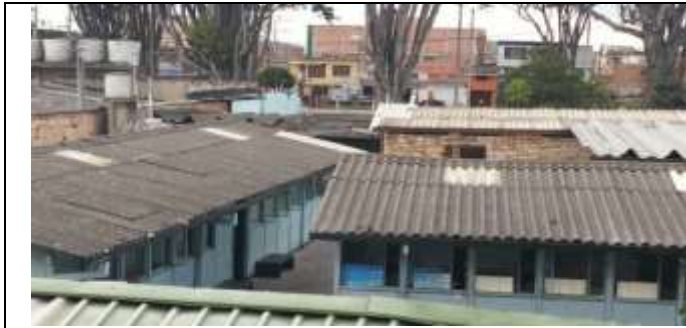
AREA DE ASULKAS SIN CORREDORES DESCUBIERTOS