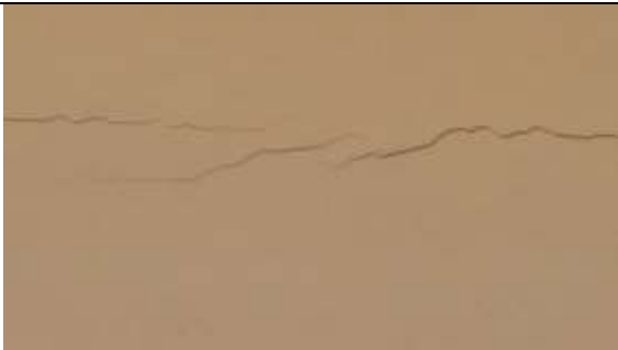
FISURAS EN VIGAS