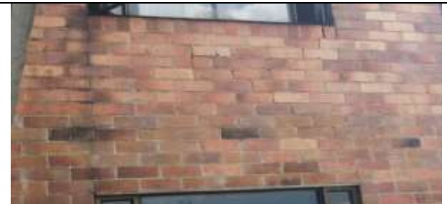
FACHADA CON FISURA EN PERIMETRAL